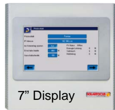
SOLARFOCUS eco manager-touch