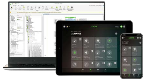
z.B. LOXONE Smart Home