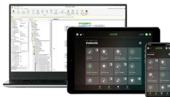
z.B. LOXONE Smart Home