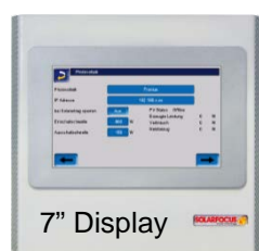
SOLARFOCUS eco manager-touch