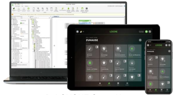
z.B. LOXONE Smart Home