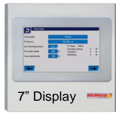
SOLARFOCUS eco manager-touch